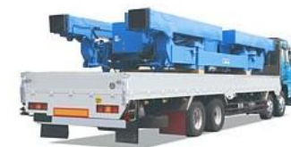
オールテレーンクレーン ブーム着脱作業